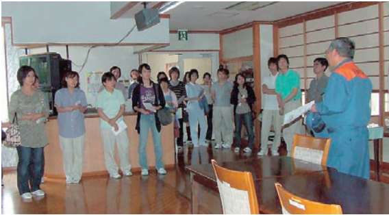
火災後に糸魚川消防署様にお越し、防災講習会を実施しました。