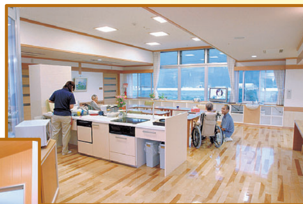
おおさわの里.さつき棟<談話室>