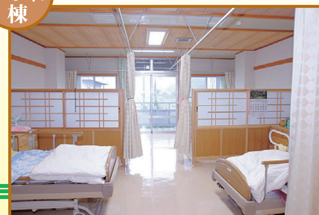
おおさわの里.すみれ棟<4人部屋>