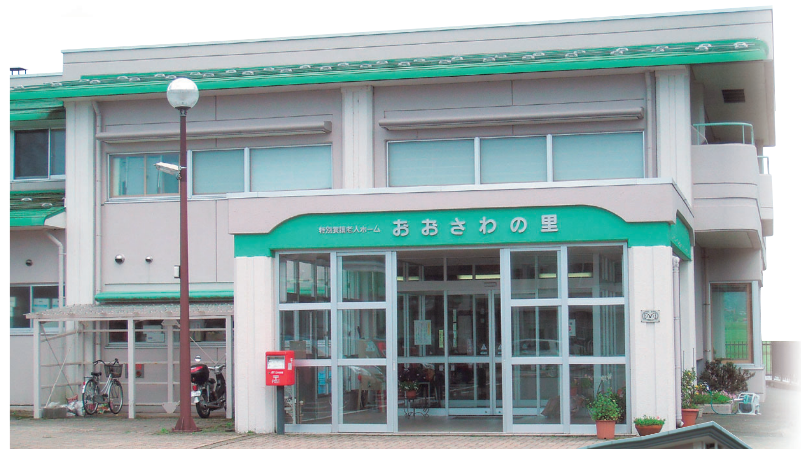
特別養護老人ホーム おおさわの里