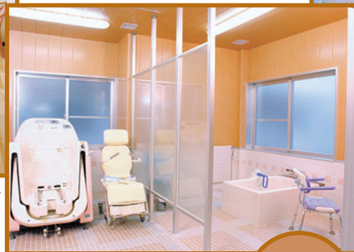
おおさわの里.さつき棟<個室>