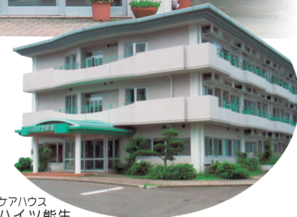
ケアハウス ハイツ能生